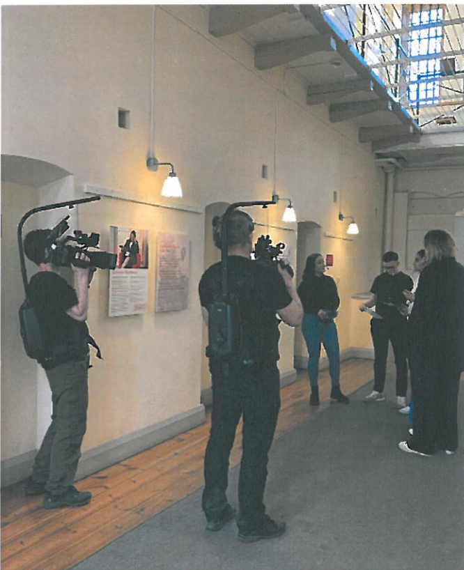
Livesändning av SVT Duo med de romska ungdomarna som varit med och stagit fram utställningen.

I samband med och på grund av utställningen valde SVT Duo att hålla en OPEN DOORS livesändning hos oss under 4 timmar, där några av ungdomarna i utställningen fick vara programledare, umgås med inbjudna kändisar och berätta om sitt romska kulturarv.