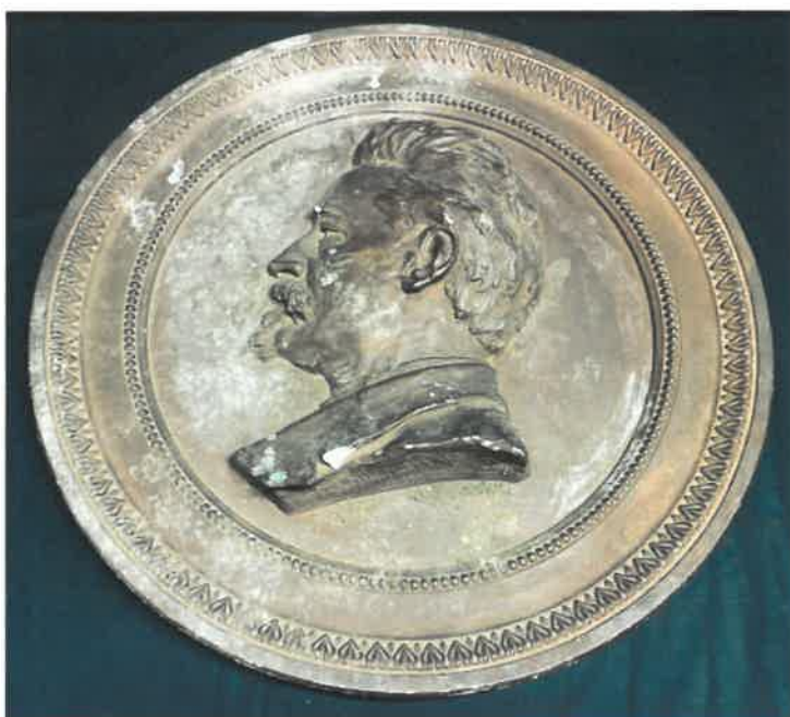
Porträttmedaljong på Sigfrid Wieselgren.