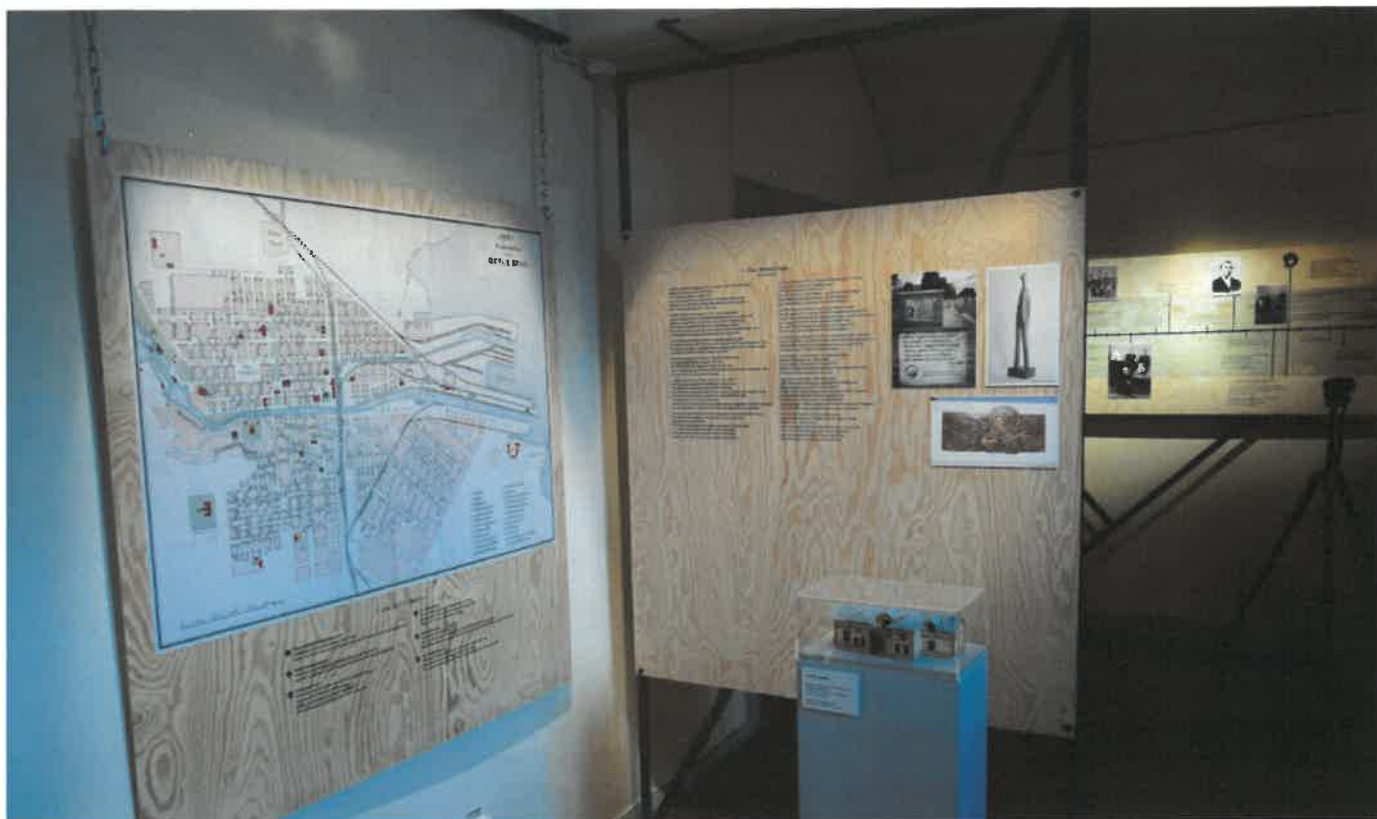
Joe Hill Visitor Center, med utställning om Joe Hill.